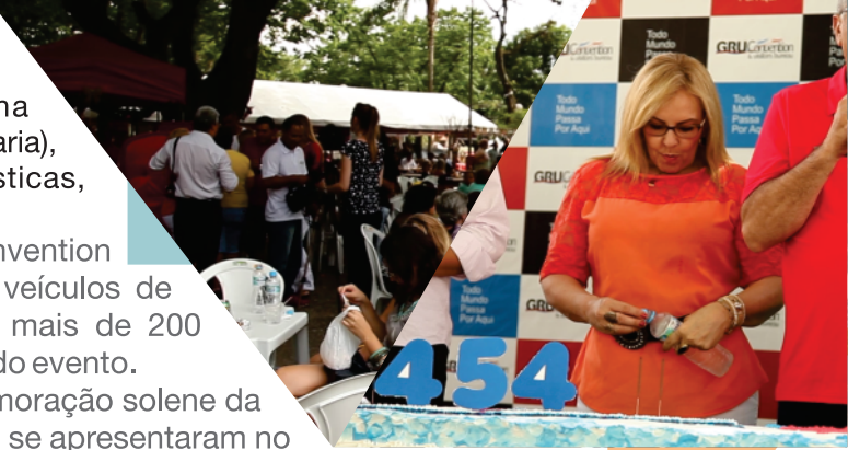
Imagem fortalecida: pioneirismo no primeiro bolo e comemoração solene da cidade, programação cultural diversa (mais de 150 artistas se apresentaram no palco do Agora é Natal)

Imagem fortalecida: divulgação em todos os principais veículos de comunicação de Guarulhos, RedeTV, Envolvimento em mais de 200 organizações e mais de 20000 visitantes ao longo dos dias do evento.