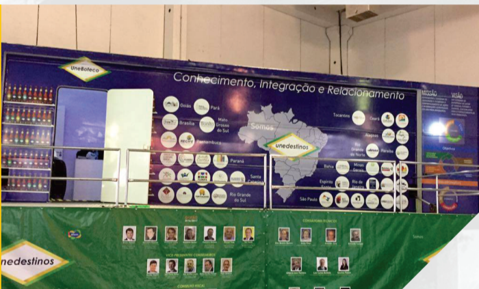
WTN Latin America 2017 Apoio a Carreta UNEDESTINOS Expo Center Norte