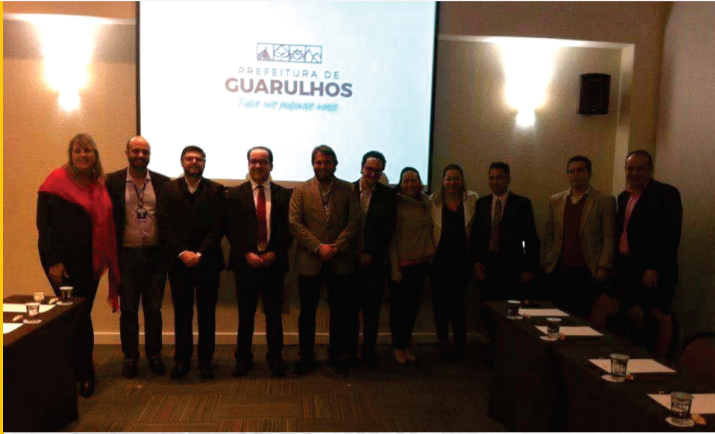
Reunião GRU Convention e Encontro Secretário SDECETI Hotel Mercure 04 de julho de 2017