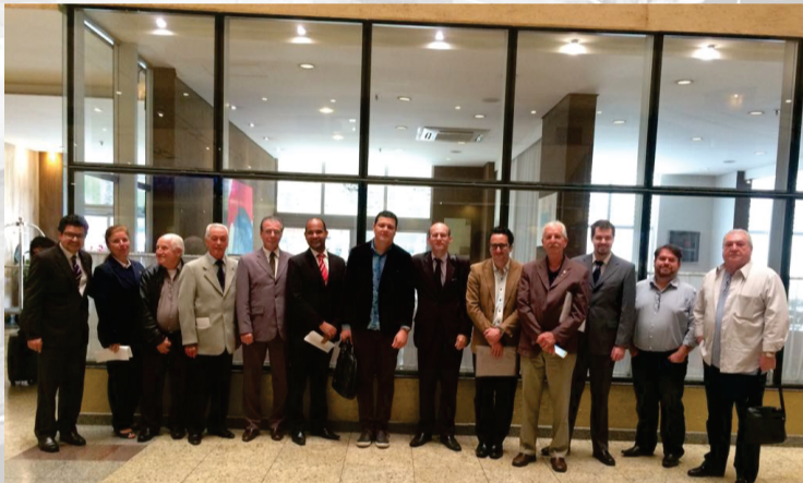
Reunião GRU Convention e COMTUR Ação ISS Hotel Bristol 07 de novembro de 2017