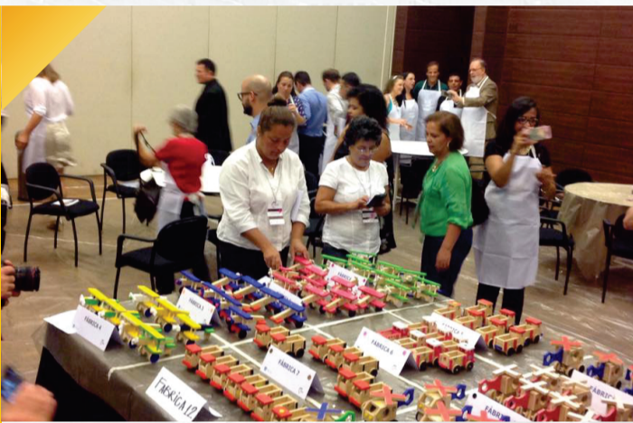
Fórum MICE Campos do Jordão Campos do Jordão Convention Center