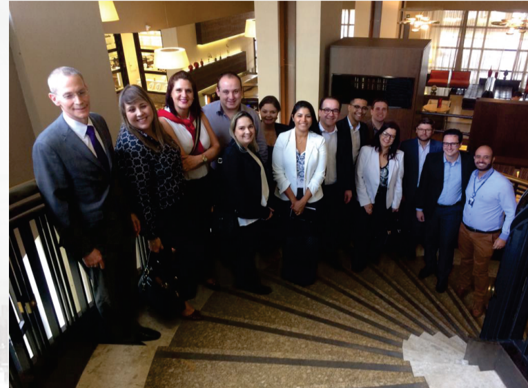
Reunião GRU Convention Hotel Marriot 26 de setembro de 2017