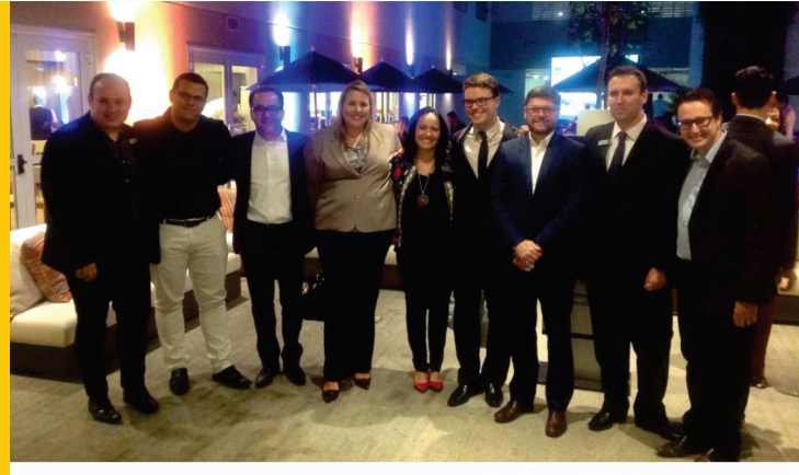
Coquetel de lançamento do Hotel Sleep In 31 de maio de 2017