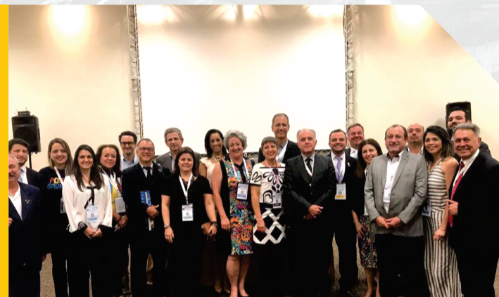
45° ABAV 48° Encontro Comercial BRAZTOA Expo Center Norte