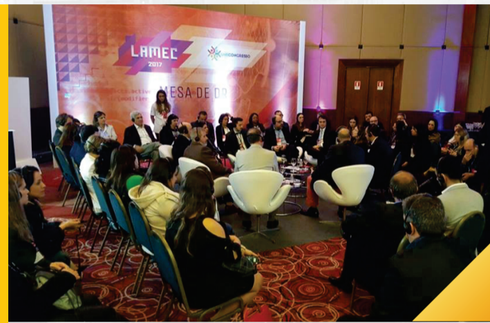
MPI Lamec 2017 e Unecongresso WTC Events Center