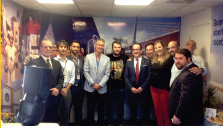
Apresentação da Sala Guarulhos no GRU Airport 25 de janeiro de 2017