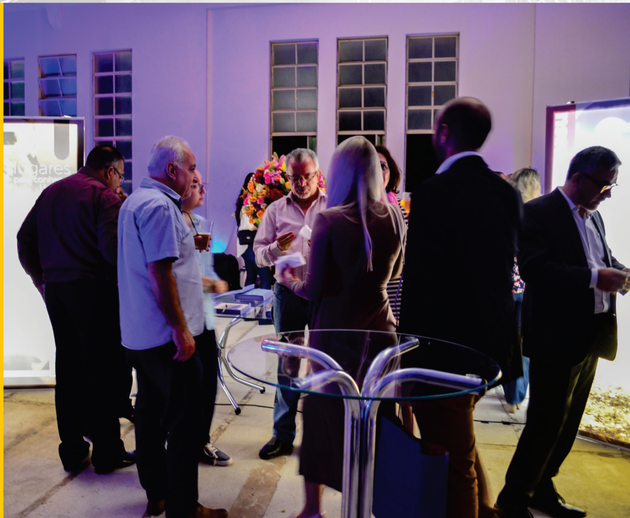
Coquetel de Lançamento Guia 100 lugares para Conhecer em Guarulhos Teatro Padre Bento 07 de novembro de 2017