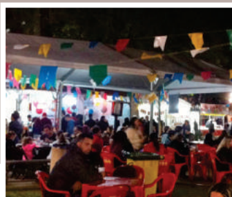
IX Festival Sabores da Praça – Edição Festa Junina, Praça Getúlio Vargas; 08.07.2015