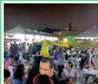
IV Festival Sabores da Praça, Parque CECAP; 08.04.2015