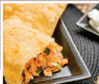
XI Festival Sabores da Praça, Praça Getúlio Vargas; 12.08.2015