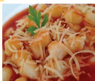
XV - Festival Sabores da Praça, SAM'S CLUB Radial Leste; 16.09.2015