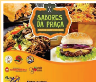
XIII Festival Sabores da Praça, Parque CECAP; 26.08.2015