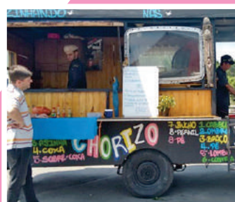
XVI Festival Sabores da Praça, Parque CECAP; 29.09.2015