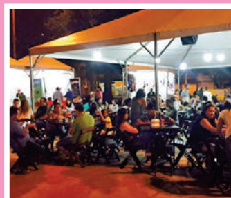
XVII - Festival Sabores da Praça, Praça Nossa Senhora Aparecida; 24.11.2015