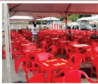
X Festival Sabores da Praça – Edição Festa Junina, Parque CECAP; 22.07.2015