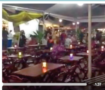
II Festival Sabores da Praça, Praça Getúlio Vargas; 18.03.2015