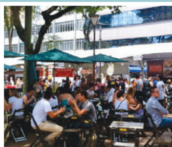
I Festival Sabores da Praça, Praça Getúlio Vargas; 23.02.2015