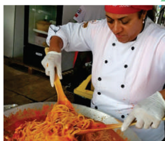
VI Festival Sabores da Praça, Parque CECAP; 13.05.2015