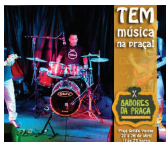
V Festival Sabores da Praça, Praça Getúlio Vargas; 22.04.2015