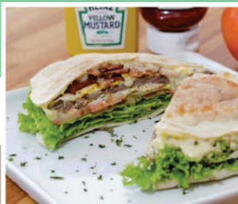
VII Festival Sabores da Praça, Praça Getúlio Vargas; 20.05.2015