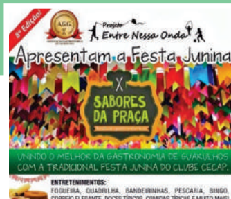
VIII Festival Sabores da Praça – Edição Festa Junina, Parque CECAP; 17.06.2015